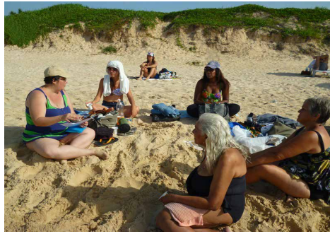
Lectura de poemas de San Juan de la Cruz junto al mar